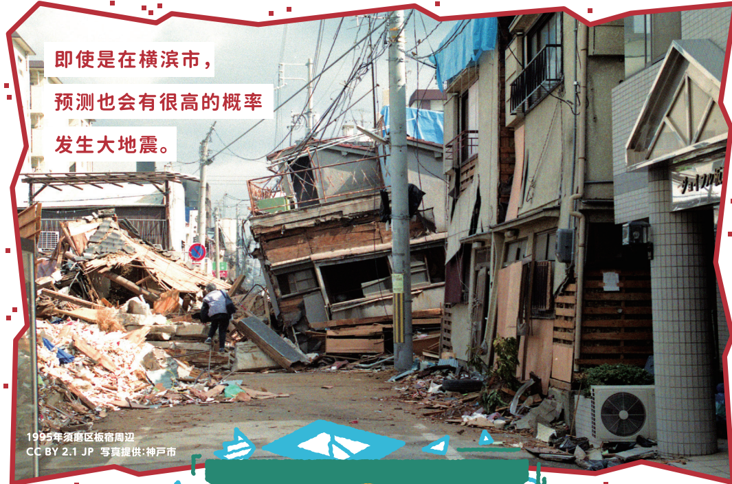
1995年須磨区板宿周辺 CC BY 2.1 JP 写真提供: 神戸市