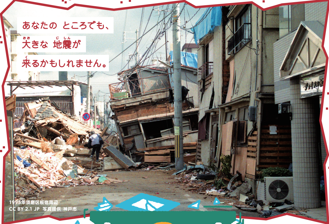
1995年須磨区板宿周辺 CC BY 2.1 JP 写真提供:神戸市

あなたの ところでも、 おほき じしん 大きな 地震が く 来るかもしれません。